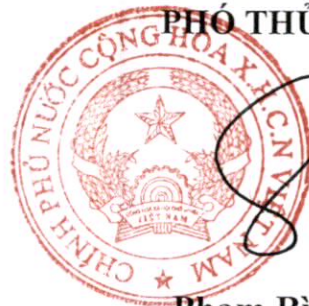
Phạm Bình Minh

TM. CHÍNH PHỦ KT. THỦ TƯỚNG PHÓ THỦ TƯỚNG